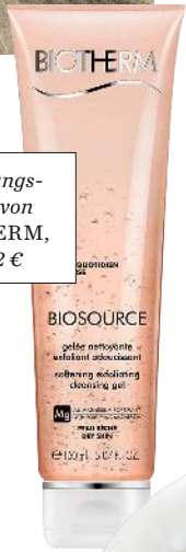
Reinigungs- pflege von BIOTHERM, um 22 €