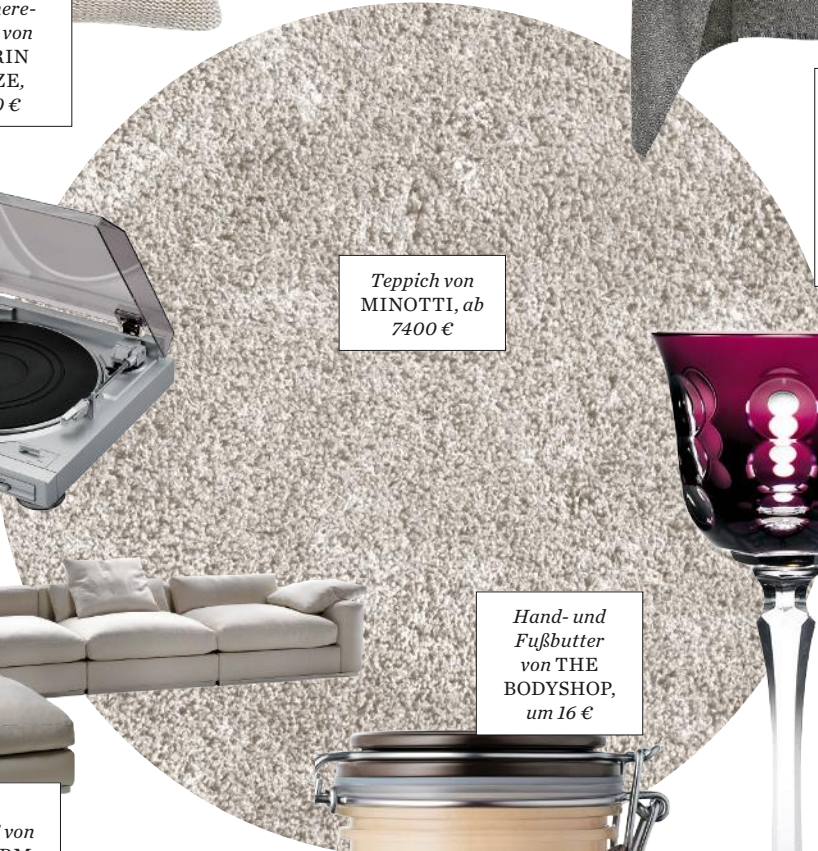
Hand- und Fußbutter von THE BODYSHOP, um 16 €