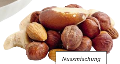
Nussmischung von KLUTH, um 3 €