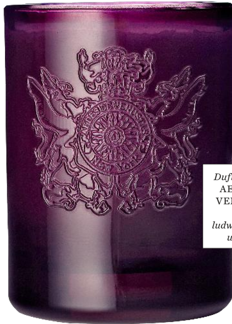
Duftkerze von AEDES DE VENUSTAS, über ludwigbeck.de, um 58 €