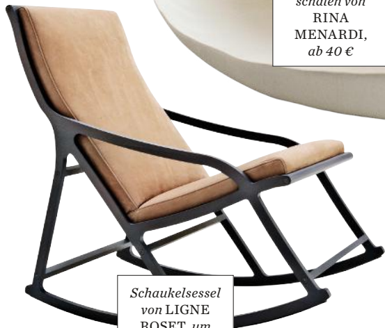
Schaukelsessel von LIGNE ROSET, um 1470 €