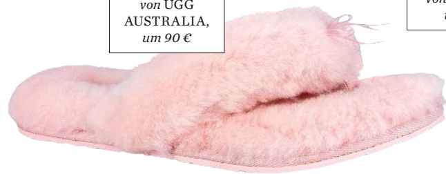
Hausschuh von UGG AUSTRALIA, um 90 €