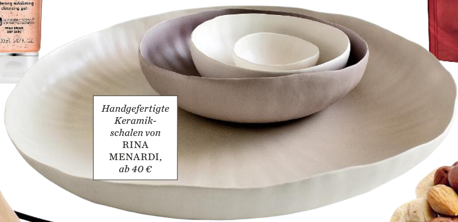
Handgefertigte Keramik- schalen von RINA MENARDI, ab 40 €