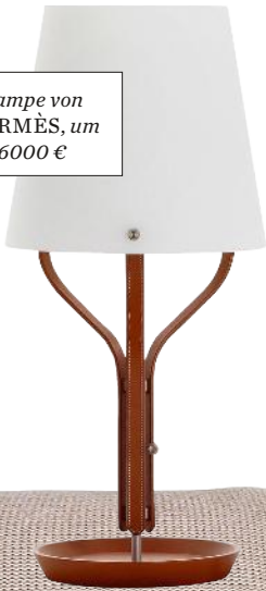
Lampe von HERMÈS, um 6000 €