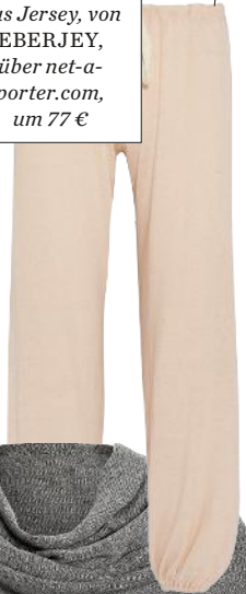
Pyjamahose aus Jersey, von EBERJEY, über net-a- porter.com, um 77 €

Mit Cashmerekissen, Duftkerze, Lounge-Sofa & Co entsteht eine wohlig- warme Ruheoase